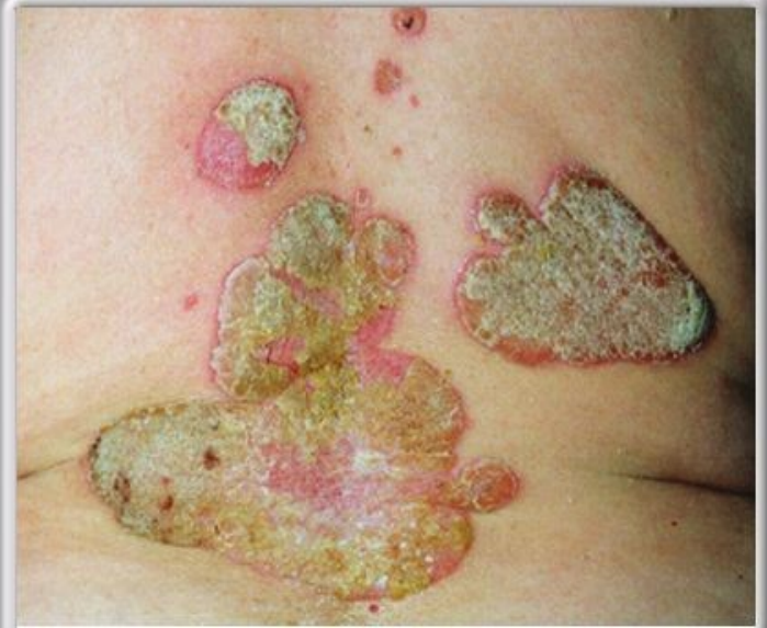
Placas eritematosas delimitadas con escamas plateadas