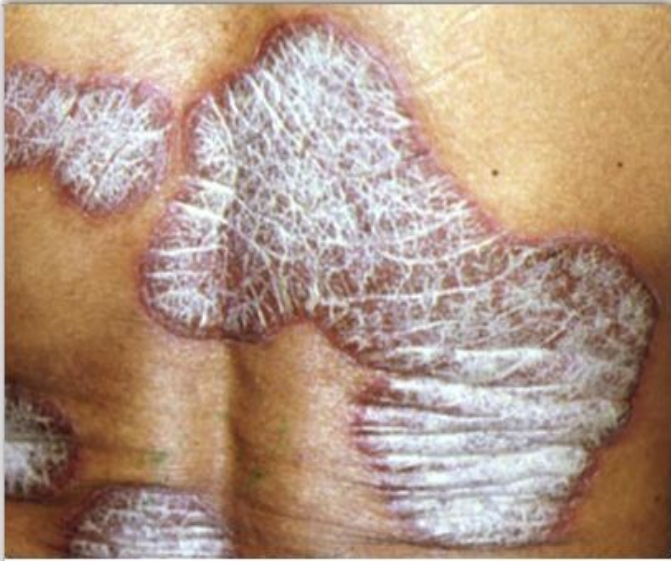
Las lesiones de la psoriasis vulgar son placas eritematodescamativas bien delimitadas