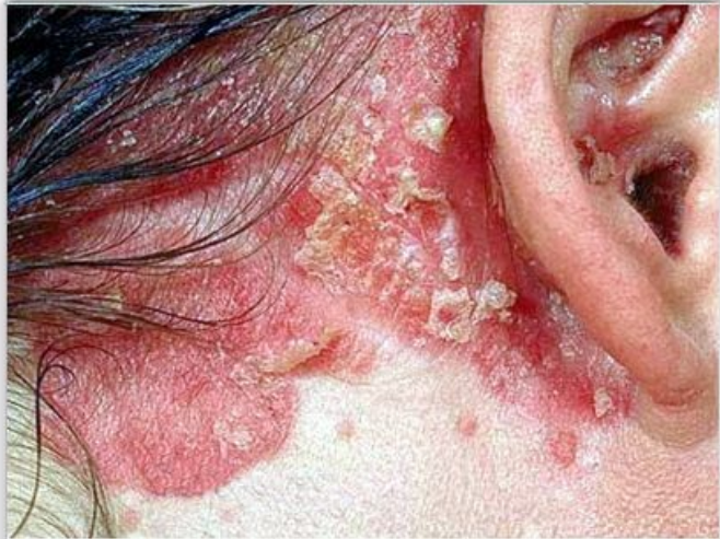
Psoriasis inducida por litio